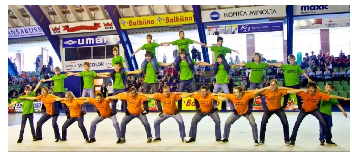
Moduse meeste müür.

Sellistest kooslustest hargneb kõige selgemini lahti ka Turnipeo üks eesmärkidest – olla kokkuhoidva pere ühiseks sportlikuks perepäevaks. Tribüünidel istuva naispere silmad särasid, tükati nägi neis lausa rõõmupisaraid ja tormilist aplausi jagati kõigile esinejatele.