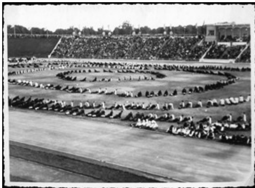
1955. aasta tantsupidu

Aastast 1955 on tantsupidusid korraldatud Kalevi staadionil ning paljud tantsijad ja tantsujuhid on sealsete tingimustega ja liikumisloogikatega harjunud. Kalevi staadion on aastate jooksul olnud parimaks valikuks tantsupidudele. Aastatega on aga staadion väsinud ja remondivajadused tingimuste kaasajastamiseks aina kasvanud. Juba 2004.