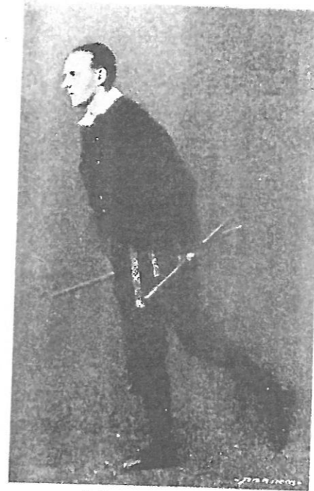
Pulgatants, II tuur.

korda, heites samal ajal vasak sääre sirgena ettepoole; ühtlasi lüüakse kokku enese ees, umbes puusade kõrgusel, enne keppide alumised ja siis pealmised otsad (25). Sellejärel tehakse kaks hüpet vasakul jalal ning heidetakse parem sääre sirgena tahapoole, ühtlasi enese taga, umbes istekoha kõrgusel, kokku lüües keppide alumised ja pealmised otsad (26). Seda kõike täidetakse veel kolm korda (27—32). Viimasel hüppel tehakse täispöörd paremale, mispeale b-d korratakse (25—32); lõpuks jälle täispöörd paremale.