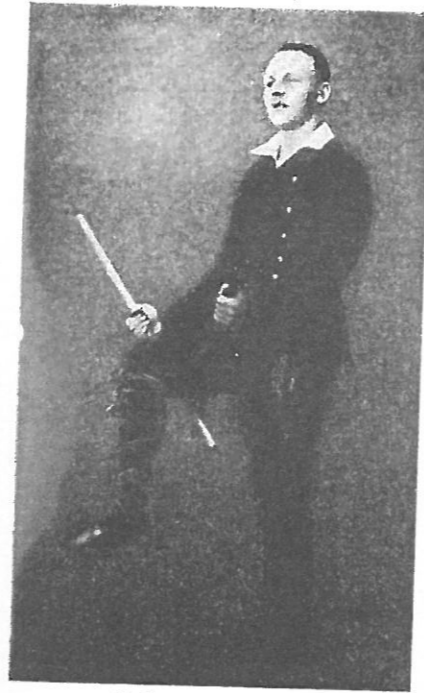
Pulgatants, I tuur.

b) Seistakse ringis, näod vastupäeva, ning tehakse koha peal järgmised hüpped: asetades parem jalg maha, hüpatakse temal kaks